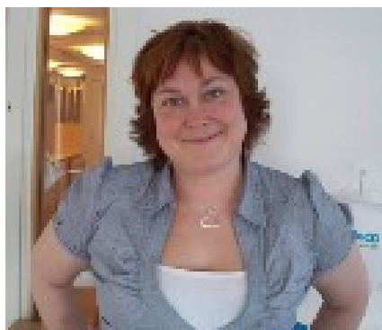
Hej alla medarbetare i TioHundra!